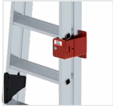
Bestell-Nr. 19840 und Bestell-Nr. 40108