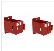
Abb. Bestell-Nr. 19840(l.) und 19838 (r.)